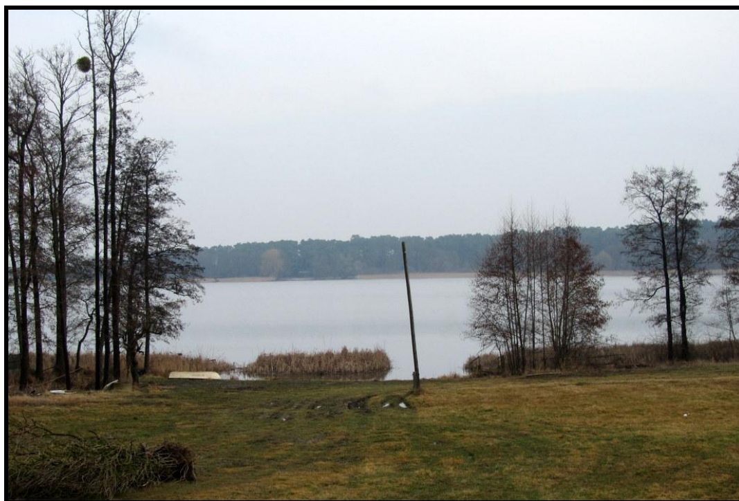
Walory przyrodnicze sołectwa – Jezioro Bnińskie

ZASOBY – wszelkie elementy materialne i niematerialne wsi i związanego z nią obszaru, które mogą być wykorzystane obecne bądź w przyszłości w realizacji publicznych bądź prywatnych przedsięwzięć odnowy wsi. Zwrócić uwagę na elementy specyficzne i rzadkie (wyróżniające wieś). Opracowanie: Ryszard Wilczyński