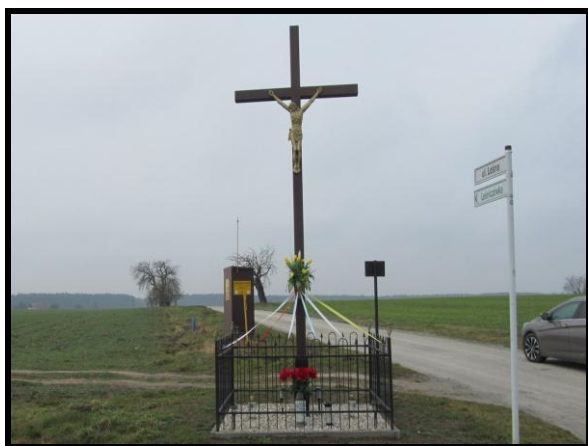
Miejsce kultu religijnego