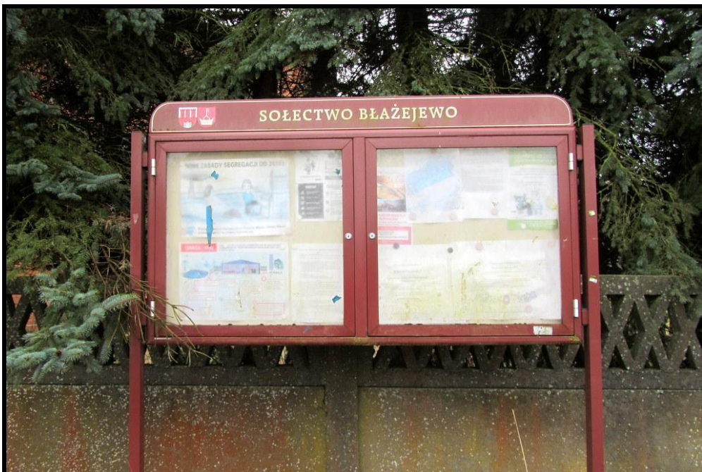
Tablica informacyjna sołectwa

SOŁECKA STRATEGIA ROZWOJU – BŁAŻEJEWO wypracowana przez GOW na warsztatach w ramach programu UMWW - „Wielkopolska Odnowa Wsi 2020+”