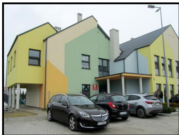
Przedszkole „Owocowy Zaułek”