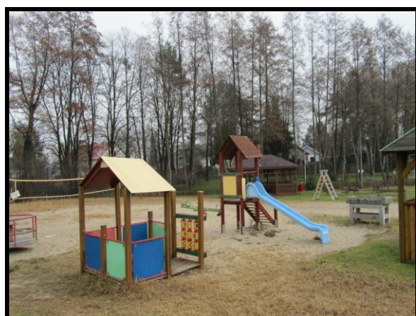
Miejsce sportu i rekreacji