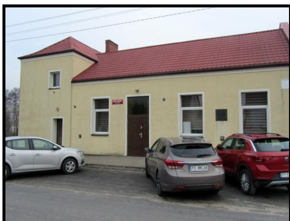
Dom Ludowy im. Jana Wójkiewicza