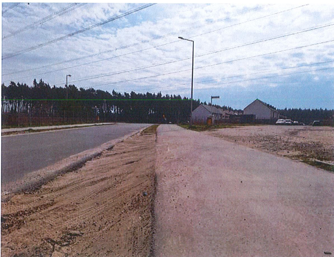
Zdjęcia obrazujące degradację ścieżki pieszo-rowerowej oraz krawędzi jezdni ulicy Spacerowej.