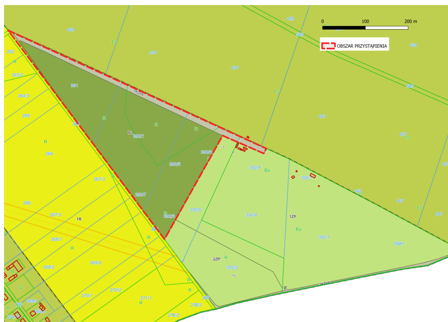
Obszar oznaczony symbolami RL oraz 1KDW, obręb Czmoń, gmina Kórnik

Obszar objęty przystąpieniem do sporządzenia planu obejmuje powierzchnię 8,28 ha.