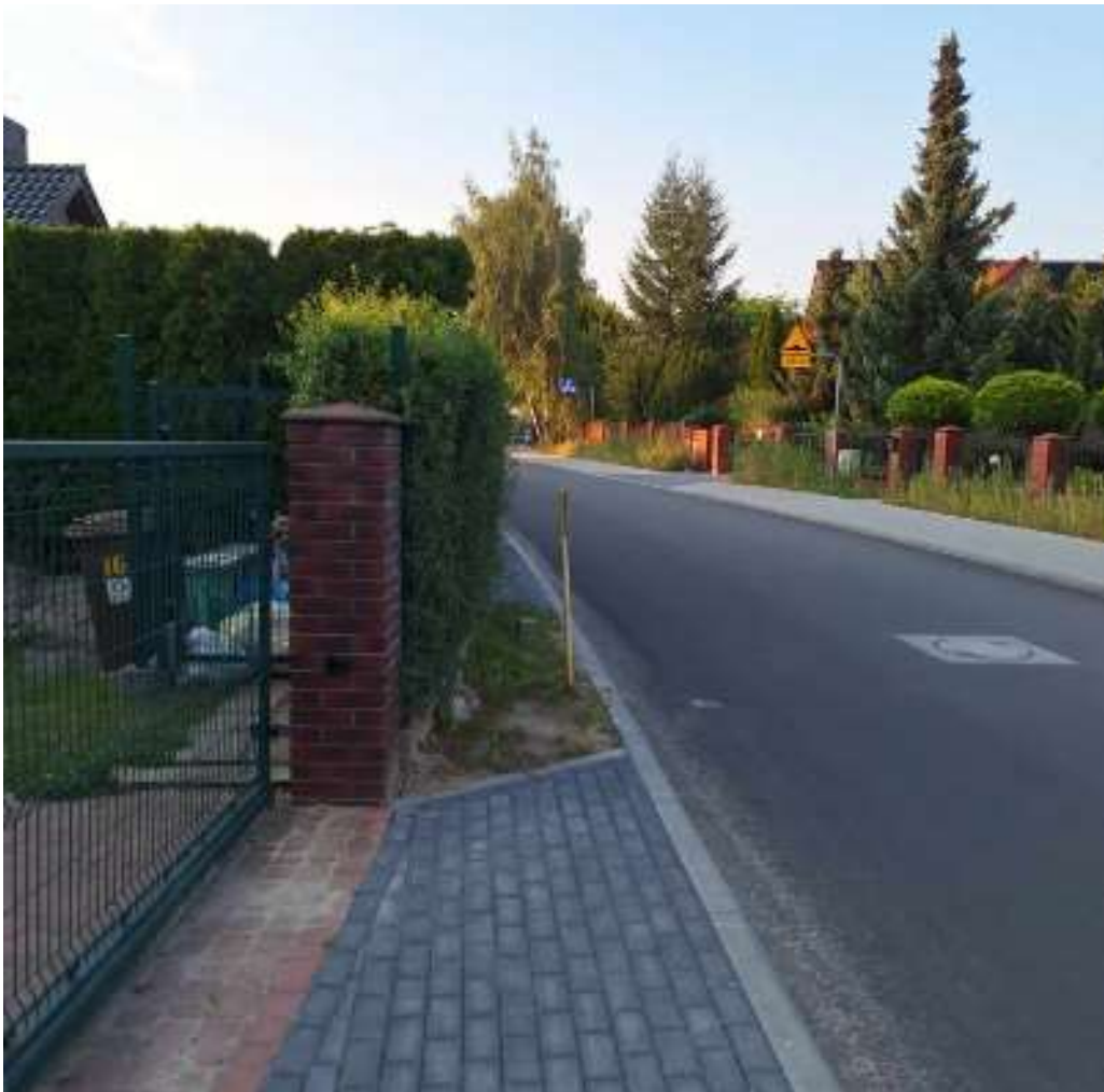
Widok dla wyjeżdżających z posesji na ulicę Lotniczą.

W imieniu mieszkańców ulicy Lotniczej 16 w Kamionkach oraz swoim własnym proszę o posadowienie lustra drogowego vis a vis wyjazdu z przedmiotowej nieruchomości.