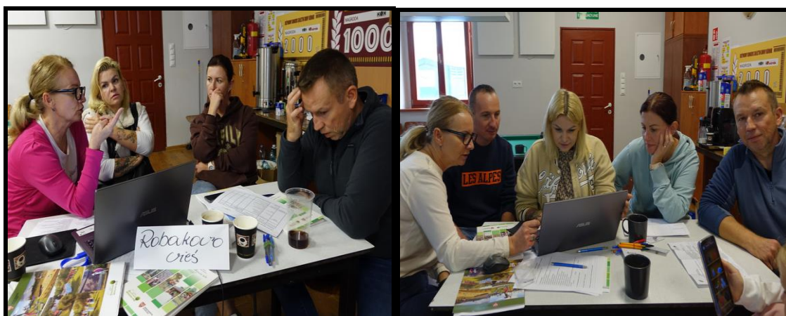
Grupa Odnowy Wsi w czasie warsztatów opracowania Sołeckiej Strategii Rozwoju. Świetlica wiejska w Robakowie - Wsi w dniach 13-14.X.2023 r.

SOŁECKA STRATEGIA ROZWOJU – ROBAKOWO - WIEŚ wypracowana przez GOW na warsztatach w ramach programu UMWW - „Wielkopolska Odnowa Wsi 2020+”