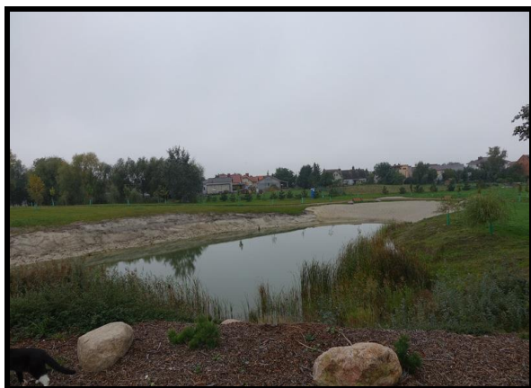
Teren rekreacyjny - Park Wiejski