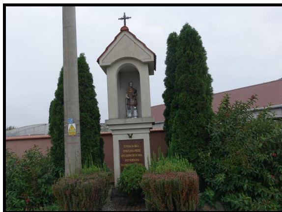
Miejsce kultu religijnego