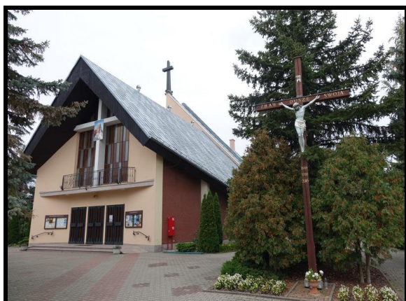
Kościół pw. Św. Józefa Rzemieślnika