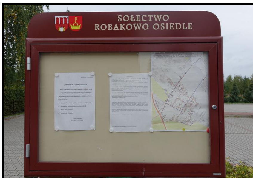
Tablica informacyjna sołectwa

SOŁECKA STRATEGIA ROZWOJU – ROBAKOWO - OSIEDLE wypracowana przez GOW na warsztatach w ramach programu UMWW - „Wielkopolska Odnowa Wsi 2020+”