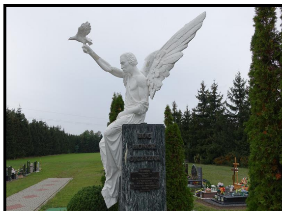
Żywa pamięć o bohaterach lokalnych