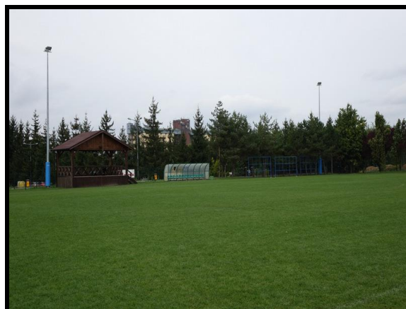
Miejsce sportu i rekreacji