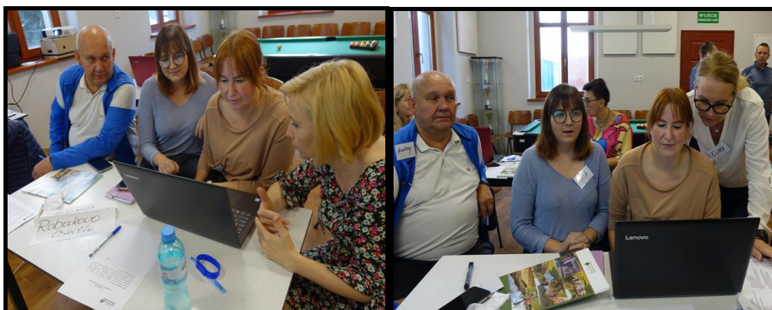
Grupa Odnowy Wsi w czasie warsztatów opracowania Sołeckiej Strategii Rozwoju. Świetlica wiejska w Robakowie - Wsi w dniach 13-14.X.2023 r.

SOŁECKA STRATEGIA ROZWOJU – ROBAKOWO - OSIEDLE wypracowana przez GOW na warsztatach w ramach programu UMWW - „Wielkopolska Odnowa Wsi 2020+”