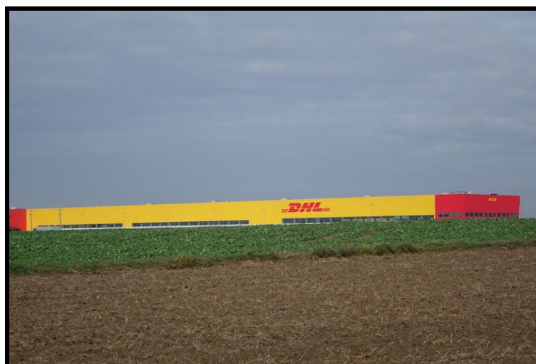
Hale magazynowe DHL na terenie sołectwa

ZASOBY – wszelkie elementy materialne i niematerialne wsi i związanego z nią obszaru, które mogą być wykorzystane obecnie bądź w przyszłości w realizacji publicznych bądź prywatnych przedsięwzięć odnowy wsi. Zwrócić uwagę na elementy specyficzne i rzadkie (wyróżniające wieś). Opracowanie: Ryszard Wilczyński