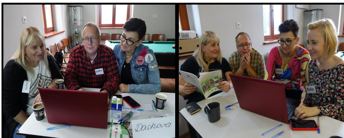
Grupa Odnowy Wsi w czasie warsztatów opracowania Sołeckiej Strategii Rozwoju. Świetlica wiejska w Robakowie - Wsi w dniach 13-14.X.2023 r.

SOŁECKA STRATEGIA ROZWOJU – DACHOWA wypracowana przez GOW na warsztatach w ramach programu UMWW - „Wielkopolska Odnowa Wsi 2020+”