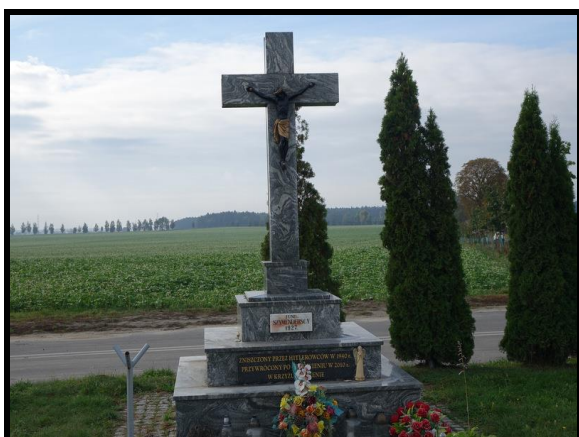
Miejsce pamięci i kultu religijnego