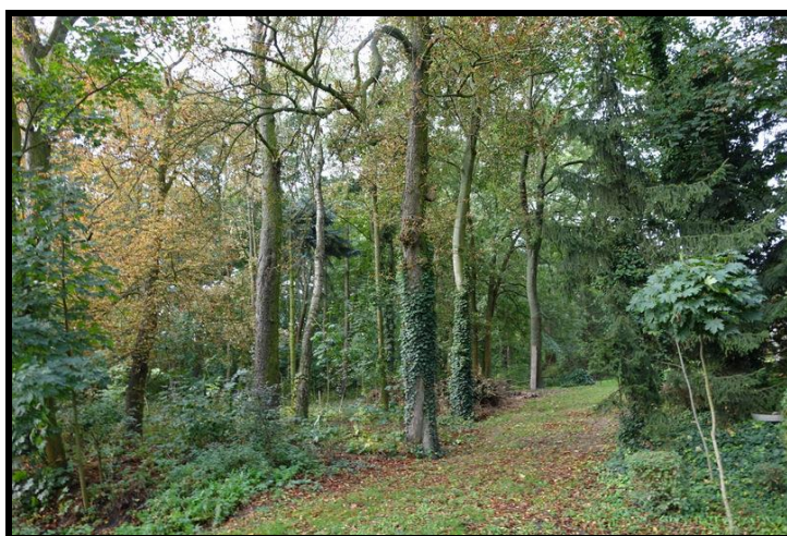
Stary park folwarku – w rękach prywatnych