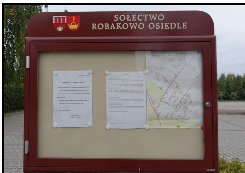
Tablica informacyjna sołectwa

SOŁECKA STRATEGIA ROZWOJU – ROBAKOWO - OSIEDLE wypracowana przez GOW na warsztatach w ramach programu UMWW - „Wielkopolska Odnowa Wsi 2020+”