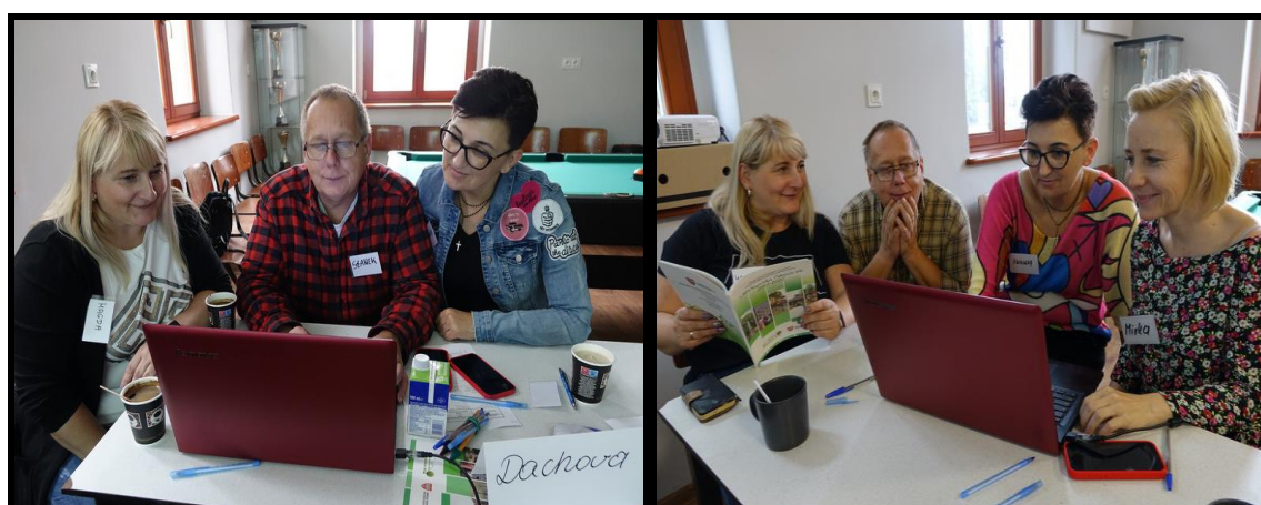
Grupa Odnowy Wsi w czasie warsztatów opracowania Sołeckiej Strategii Rozwoju. Świetlica wiejska w Robakowie - Wsi w dniach 13-14.X.2023 r.

SOŁECKA STRATEGIA ROZWOJU – DACHOWA wypracowana przez GOW na warsztatach w ramach programu UMWW - „Wielkopolska Odnowa Wsi 2020+”